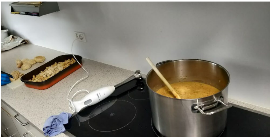
Tømt køleskab og brødsuffe giver herlig grøntsagssuppe og brødtern