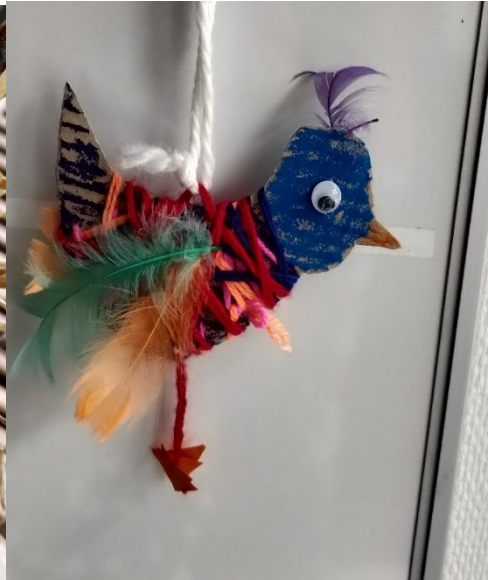
en af mange skønne papkasseful