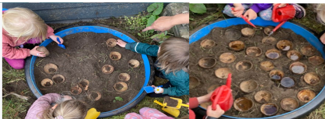
Insekter og fugle skal have adgang til vand. Det klarede vi med genbrugsrør og kokosnødder