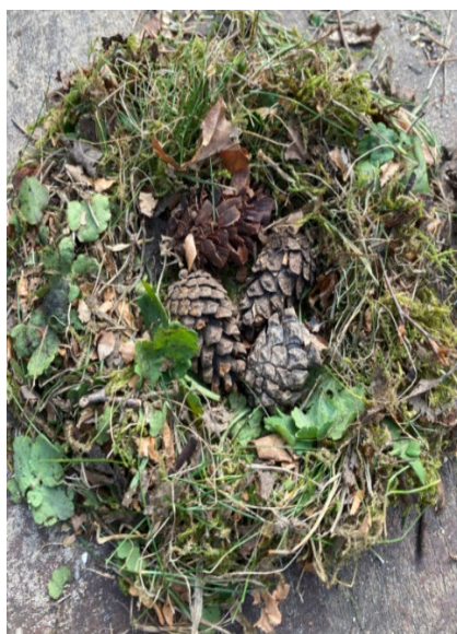
En naturtro fuglerede

Vi prydede gennem ½ år alle hjørner i huset med fuglerelaterede kreationer, lavet af natur og genbrugsmaterialer fra gemmerne, her er blot nogle få eksempler af mange.