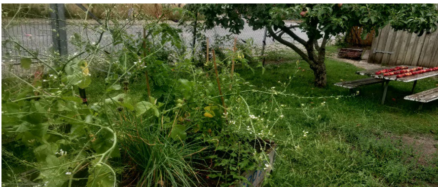
Gemte tomatkerner blev til årets tomatplanter, ukrudtet voksede med til glæde for dyrelivet