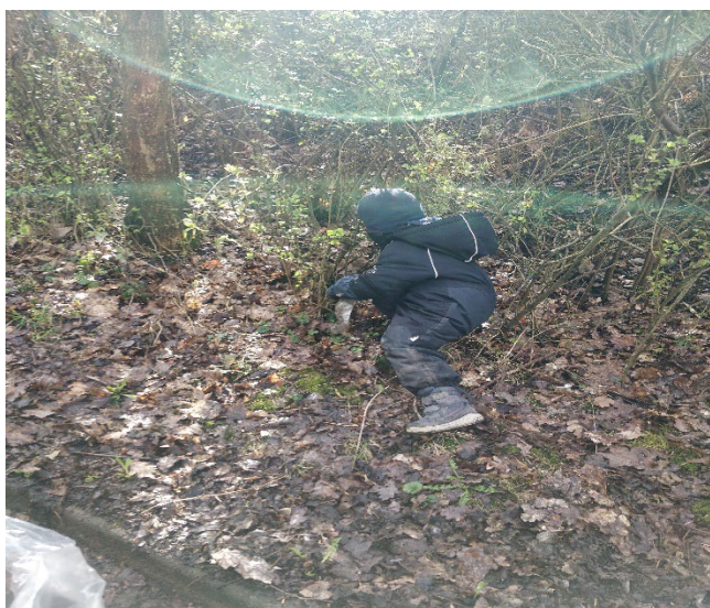
samle affald i nærområdet