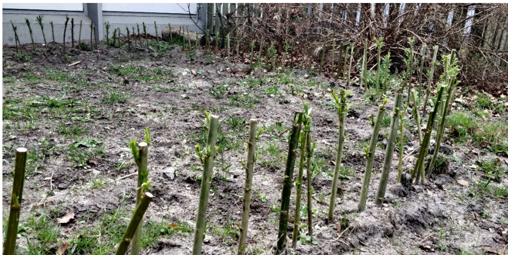
plante pilehytte og hegn af aflagte pilekviste