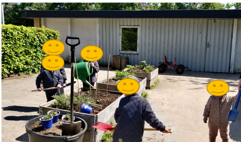
så aflæggere af planter og urter, som vi fik fra børnenes haver