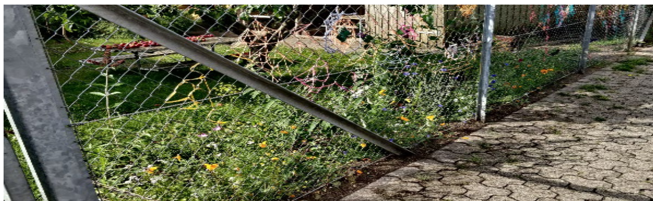
Vilde planter, sommerfuglebuske og en smule såede sommerblomster er blevet spisekammer for sommerfuglene