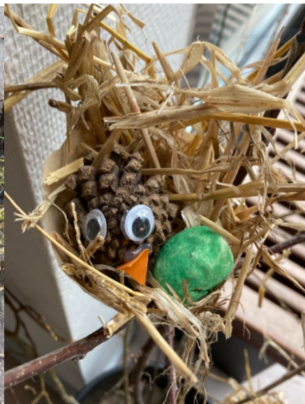
fuglereder af fejlindkøbte kaffefiltre