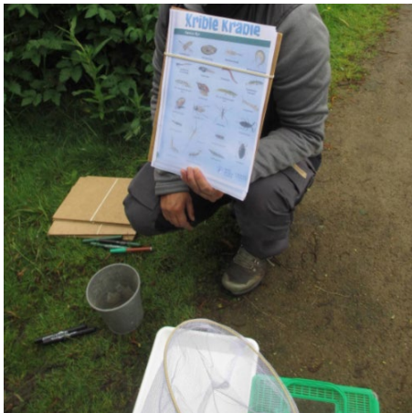
Besøg af M.. fra DOF, som talte om fugle og krible-krabledyr