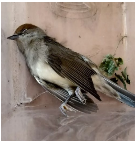
Den lille hun munk

Munken vakte en nysgerrighed på fugle, der gennem ½ år bragte både børn og os vidt omkring.